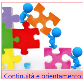
Continuità e orientamento

educativa superando le frammentazioni e valorizzando l'intreccio tra i diritti alla cura, al benessere, all'educazione e all'istruzione.